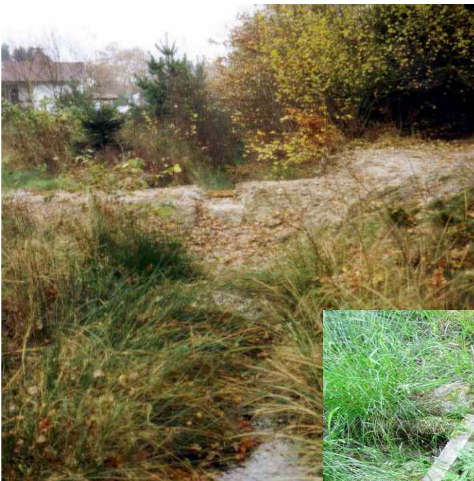
Stau Süllitz 1999