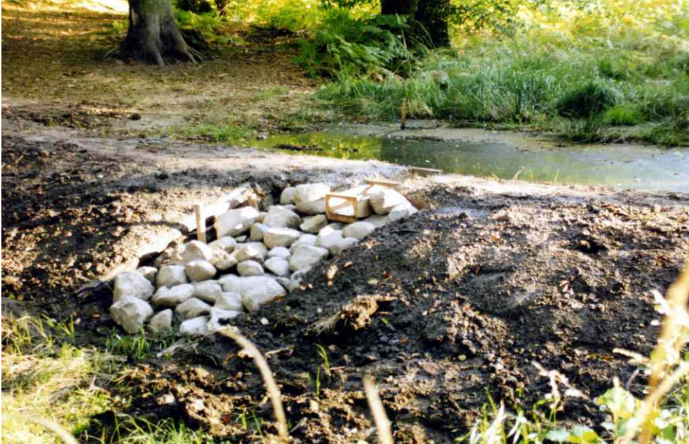
Stau am Postmoor 1999