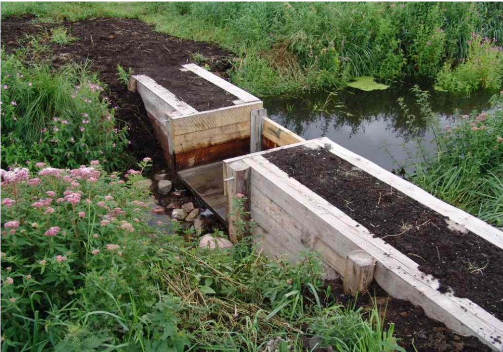
2006 errichteter Stau