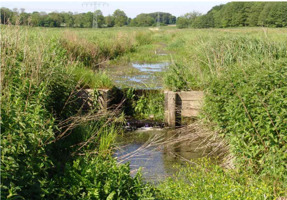
bereits 1 Jahr später fügte sich der Stau perfekt in das Landschaftsbild ein