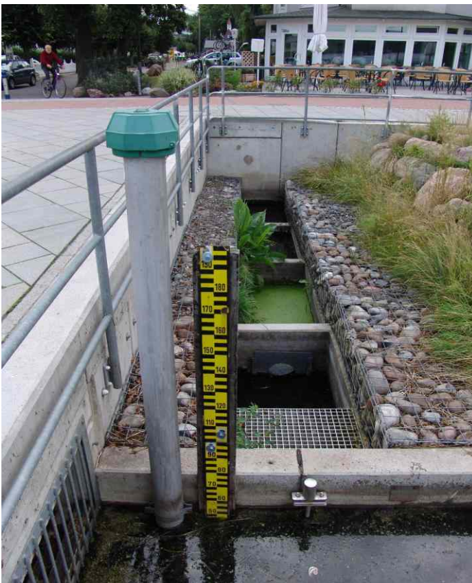
Auslaufbauwerk nach Beendigung der Maßnahme 2001