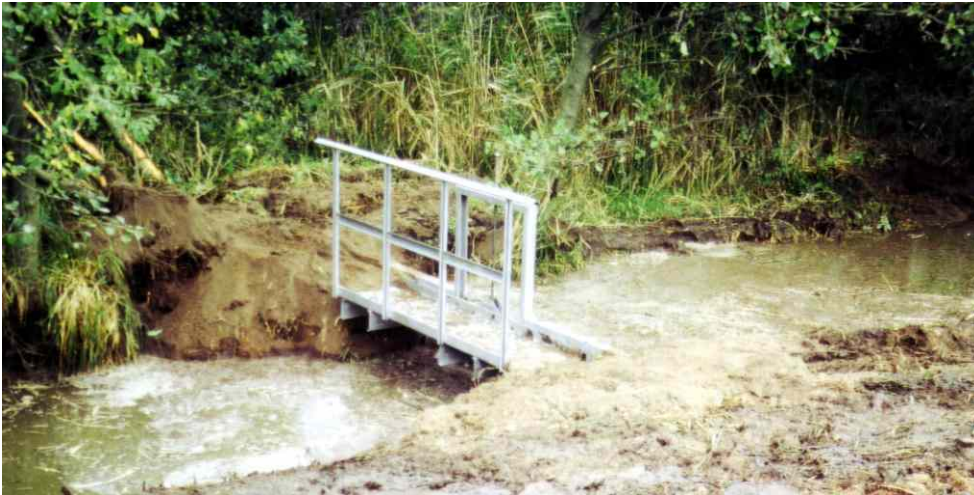
Abriegeln des Stichgrabens mit regulierbarem Stau

Folgemaßnahmen: weitere Pflege der Feuchtwiesen (StALU)