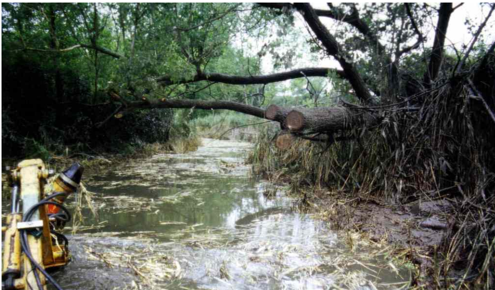
Entschlammung des Bachlaufes