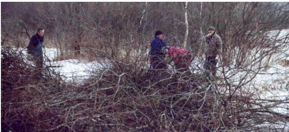
Entbuschung der Feuchtwiesen