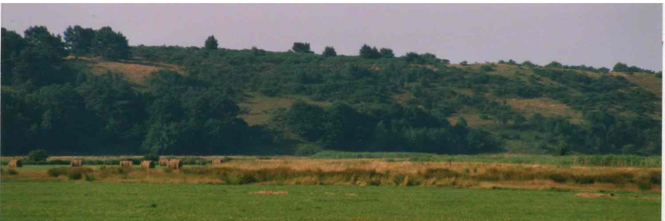
Fliegerberg vor der Entbuschung

Folgemaßnahmen: Der Fliegerberg ist an einen Landwirt verpachtet und wird mit Rindern beweidet und gemäht. Teile davon wurden mit Projektmitteln durch den LPV erworben. Im Pachtvertrag mit dem Landwirt ist festgelegt, dass keine mineralische Düngung und keine Pflanzenschutzmittel ausgebracht werden dürfen, eine erneute Verbuschung ist durch eine ausreichende Besatzstärke und eine Mahd pro Jahr zu gewährleisten. Die letzte Kontrolle durch den LPV erfolgte 2009. Es zeigte sich, dass sich der Ginster trotz Beweidung und Mahd wieder beginnt auszubreiten.