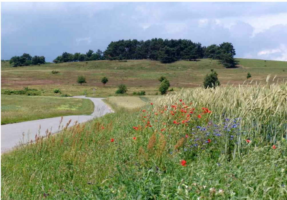
Fliegerberg nach Beendigung der Maßnahme