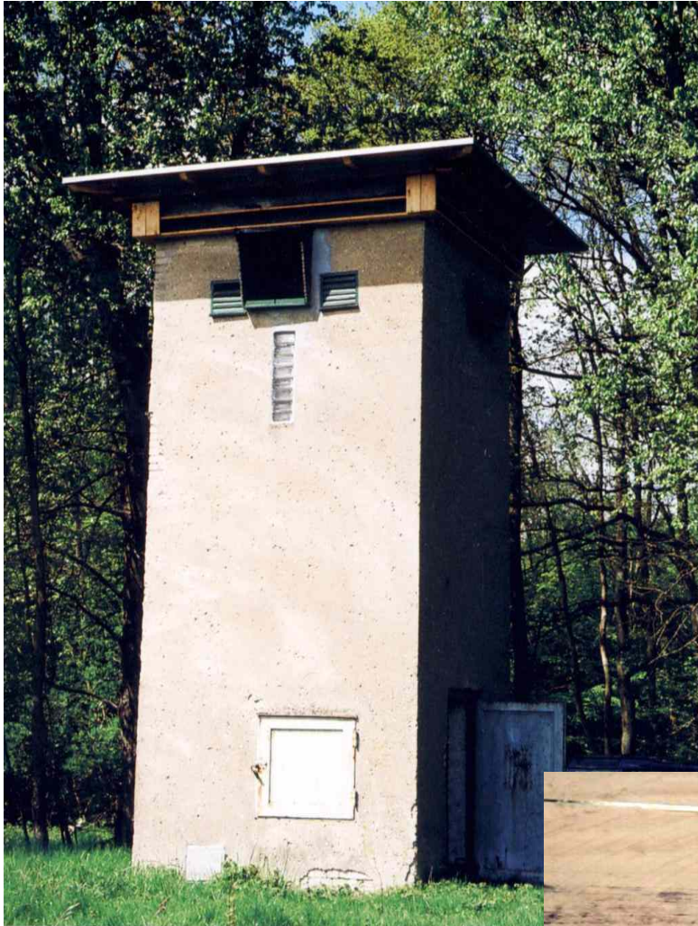
fertig gestelltes Trafohaus 2004

bereits kurz nach Fertigstellung haben Schleiereulen Quartier bezogen