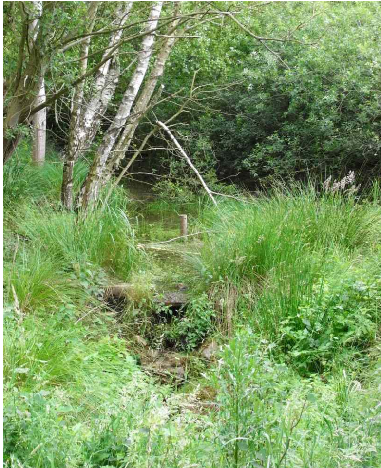
2008 war der Stau vollständig eingewachsen und kaum noch zu erkennen