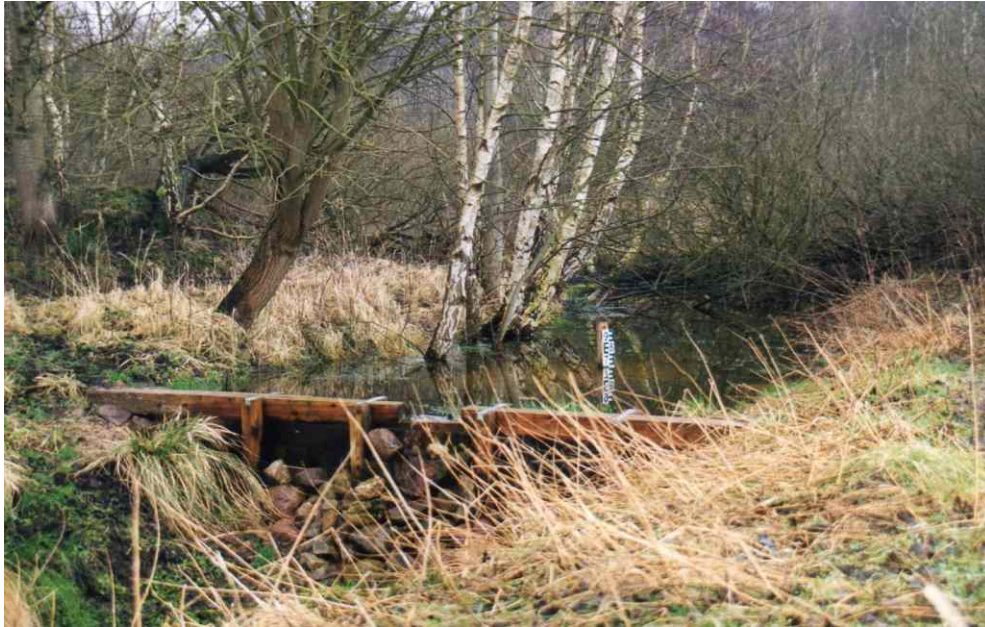
Stau kurz nach Fertigstellung