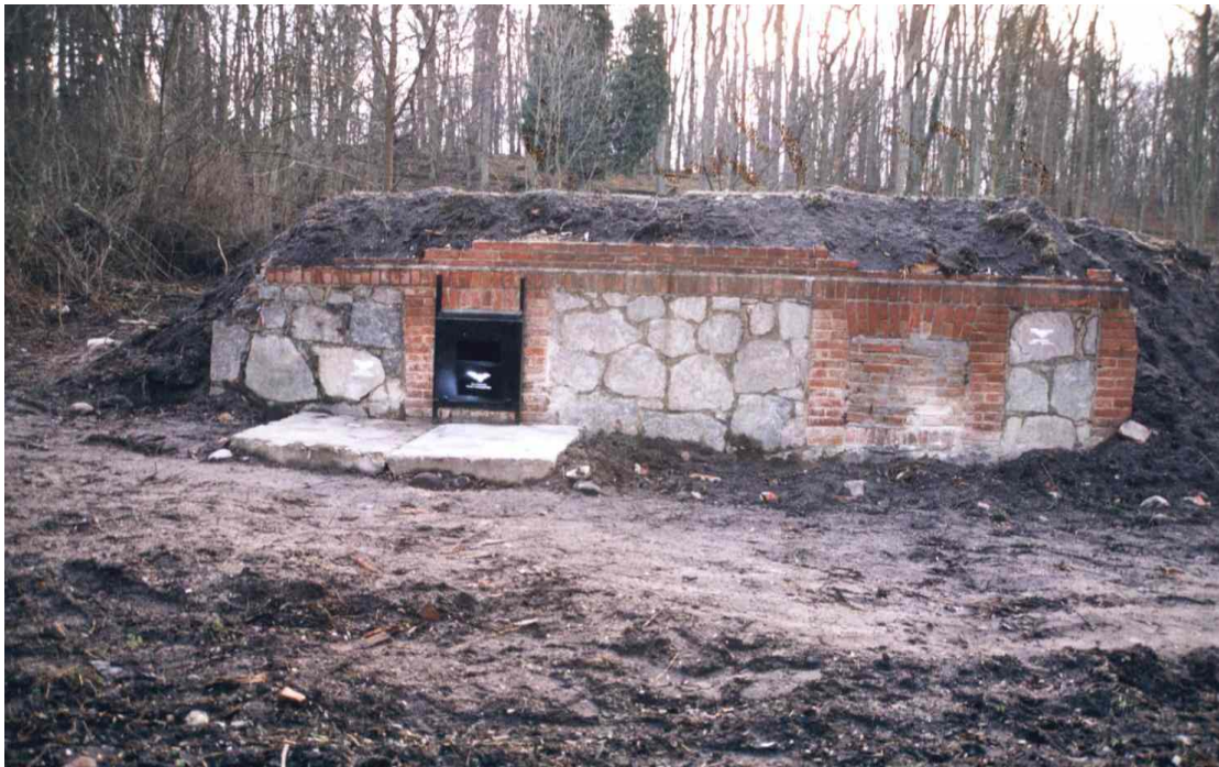
Einbau von Fledermausquartieren