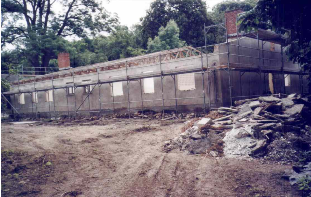
Rückbau des Flachbaus