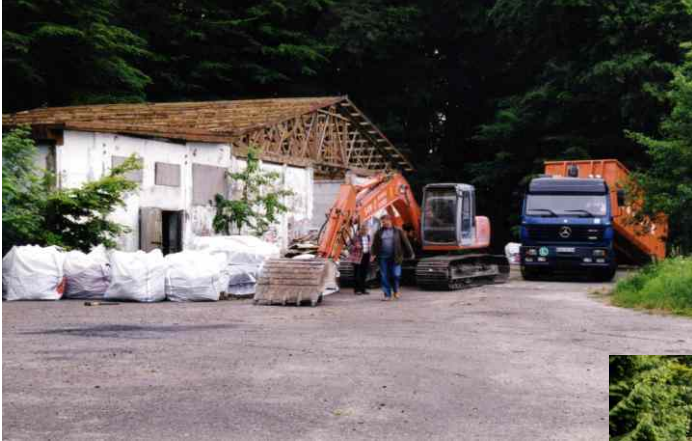
Rückbau der Bootshalle