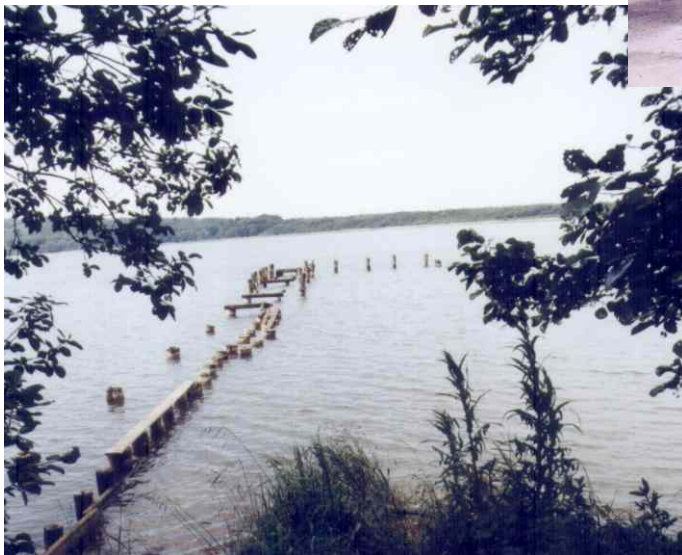
Rückbau des Bootsanlegers