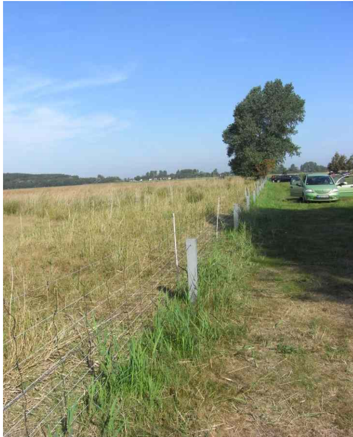
1997 errichteter Zaun (Foto 2009)