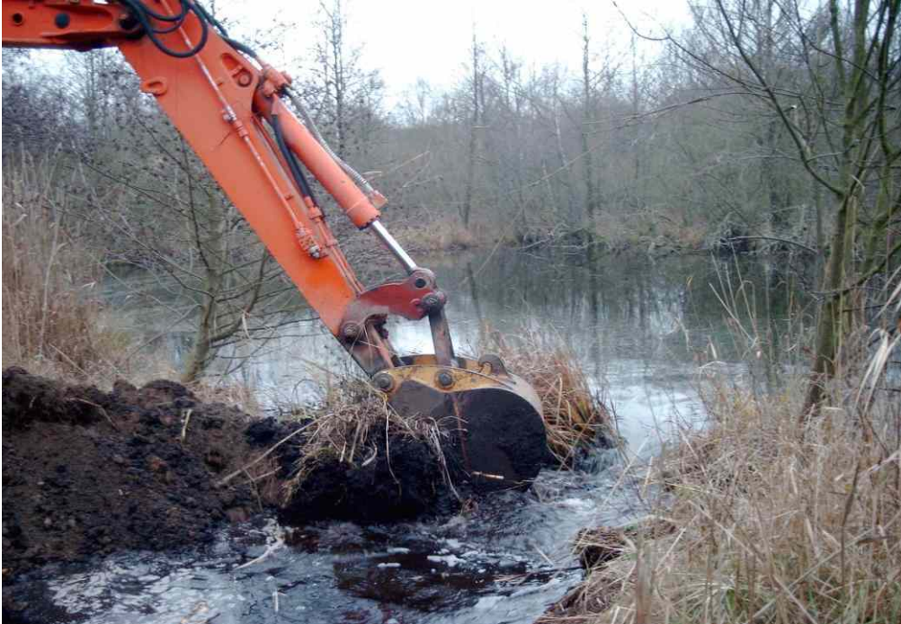
Schlitzung des Dammes zwischen den Torfstichen