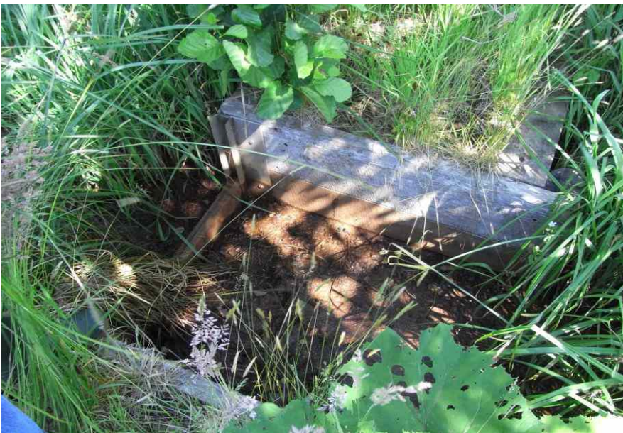
der Stau fügt sich gut in die Umgebung ein (Foto 2008)