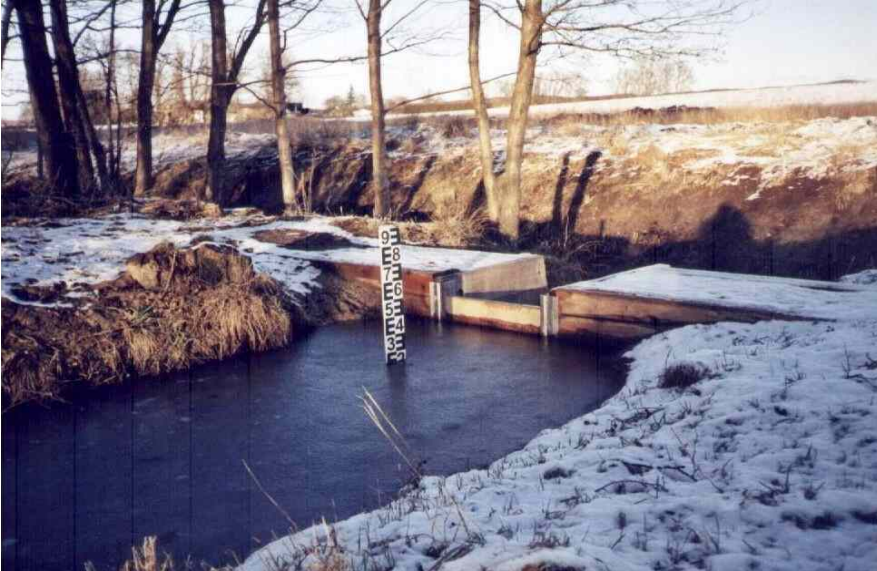
neu errichteter Stau 2003