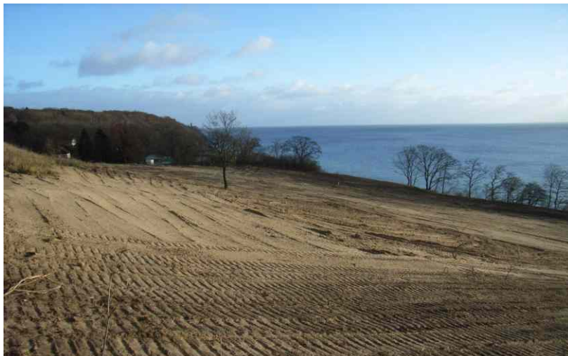
Planieren des Geländes