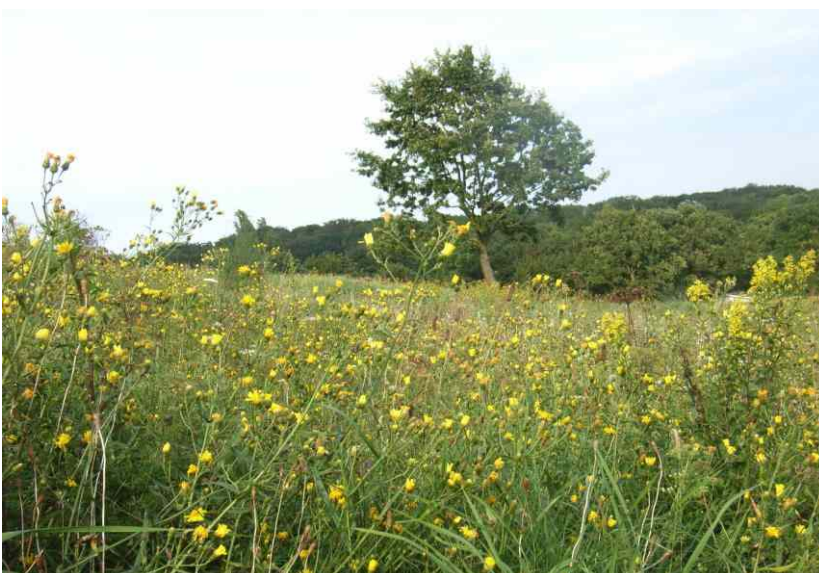
bereits 2007 war das Gelände begrünt