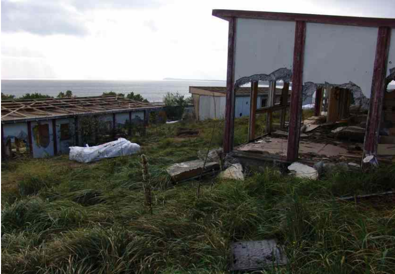
Rückbau der alten Bungalowanlage