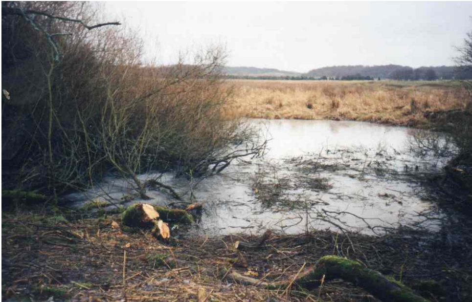
Freischneiden der Amphibienlaichgewässer