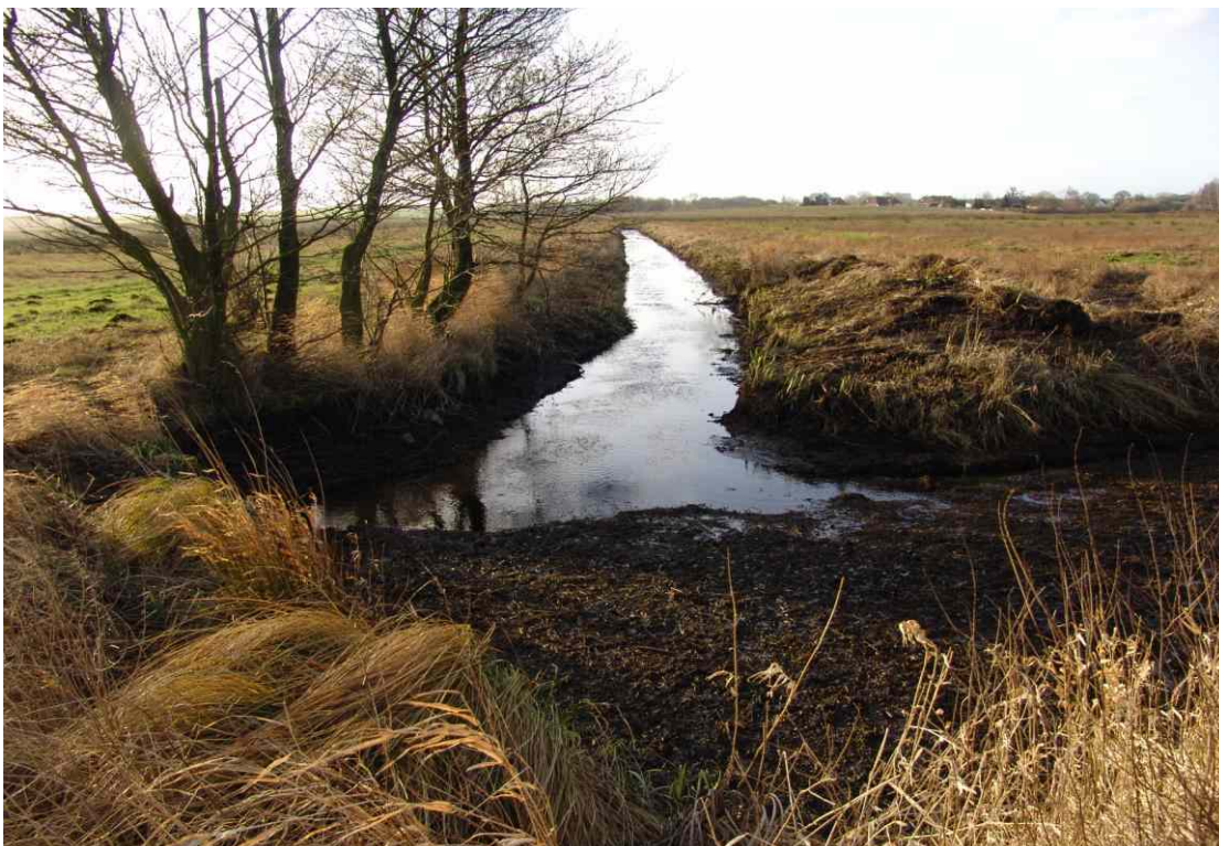
nach der Grabensanierung 2001