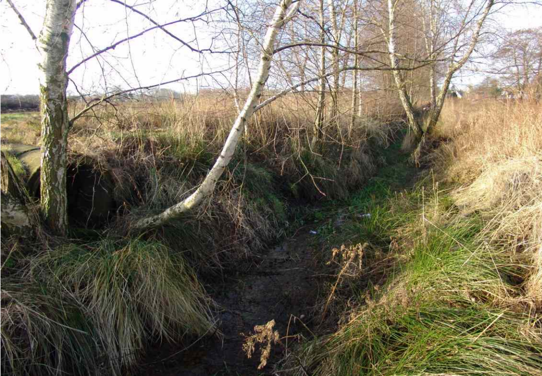
vor der Grabensanierung 1997