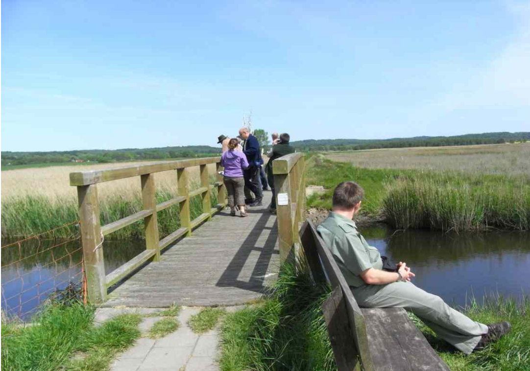
Brücke über den Durchstich (Foto 2008)