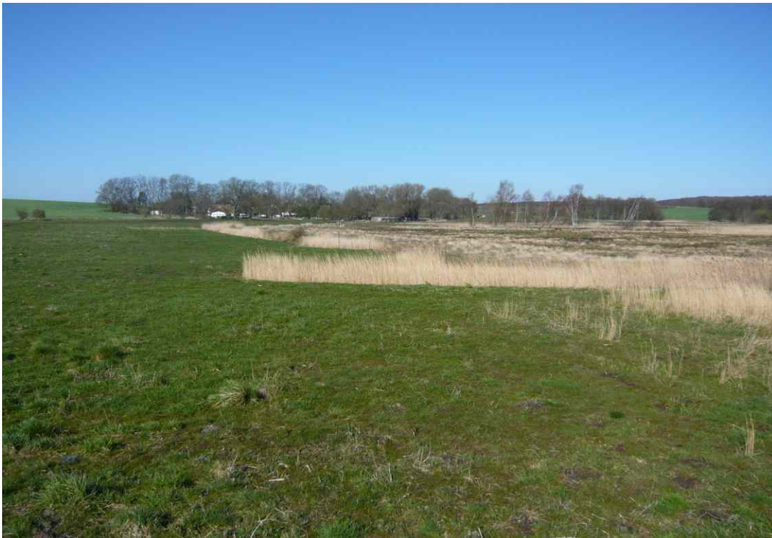
bewirtschaftetes Grünland 2008