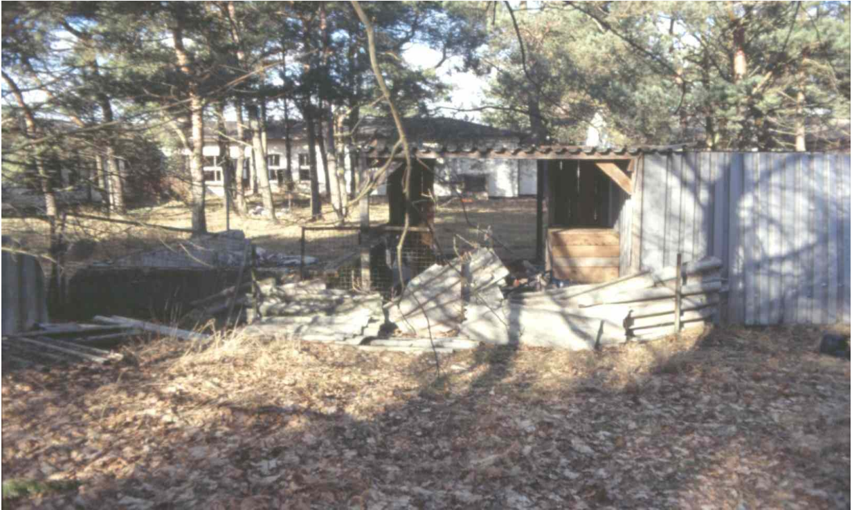
desolate Bungalowsiedlung vor dem Rückbau